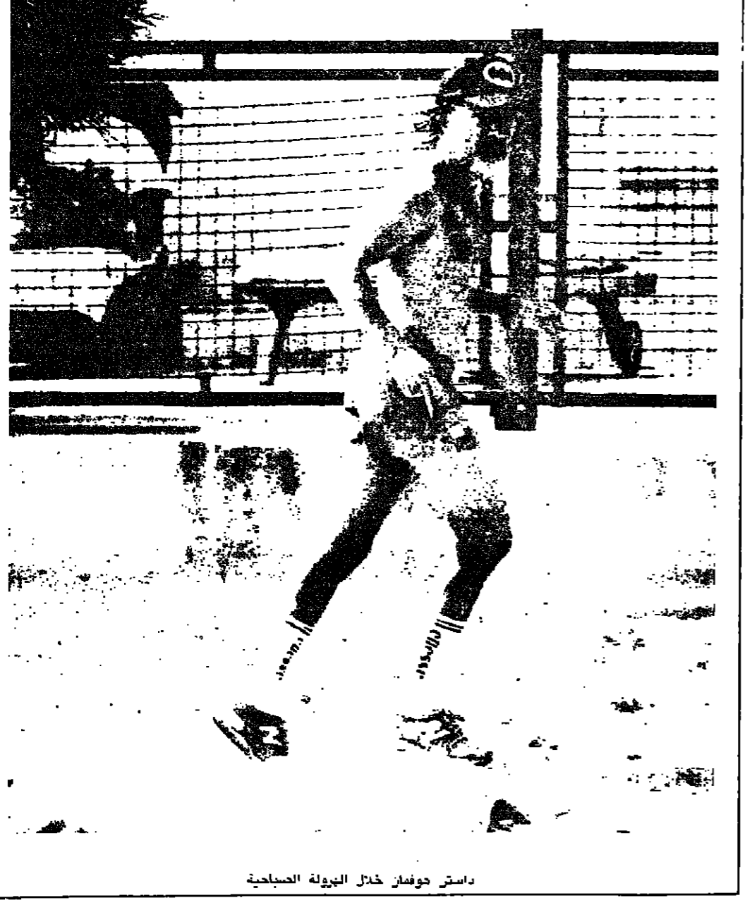
داستن هوفمان خلال الهرولة الصباحية